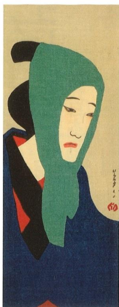
竹久夢二「治兵衛」1914年 木版