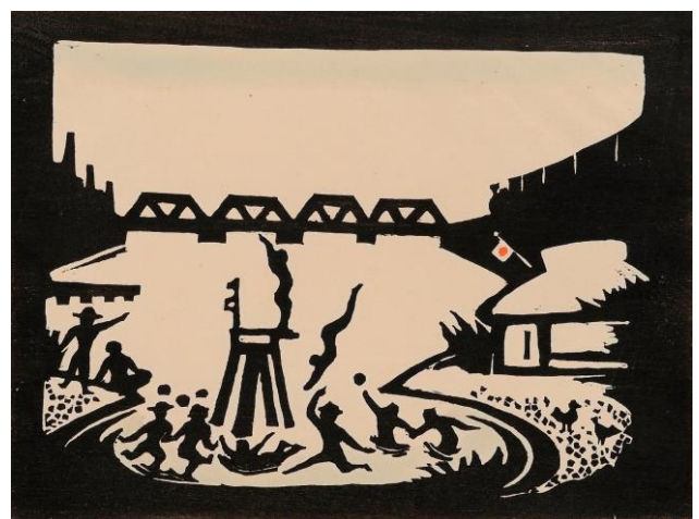
no.88 谷中安規 少年画集6 水遊び

2016年7月9日発行 町田市立国際版画美術館 〒194-0013 東京都町田市原町田4-28-1 http://hanga-museum.jp/