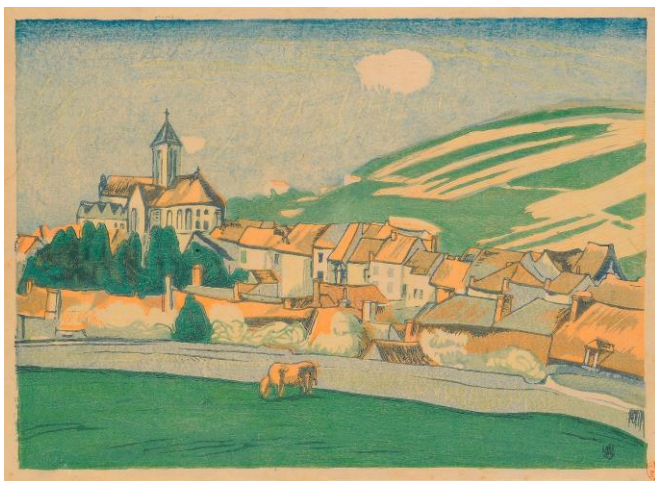
no.2 山本鼎 フランス田園の春