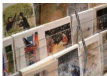
ミュージアムショップ Museum Shop