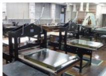
版画工房 Print Studio

■作品の熟覧をご希望の方は特別閲覧制度をご利用下さい。 利用可能日は水曜日の午後と土曜日の午後(要予約/有料)