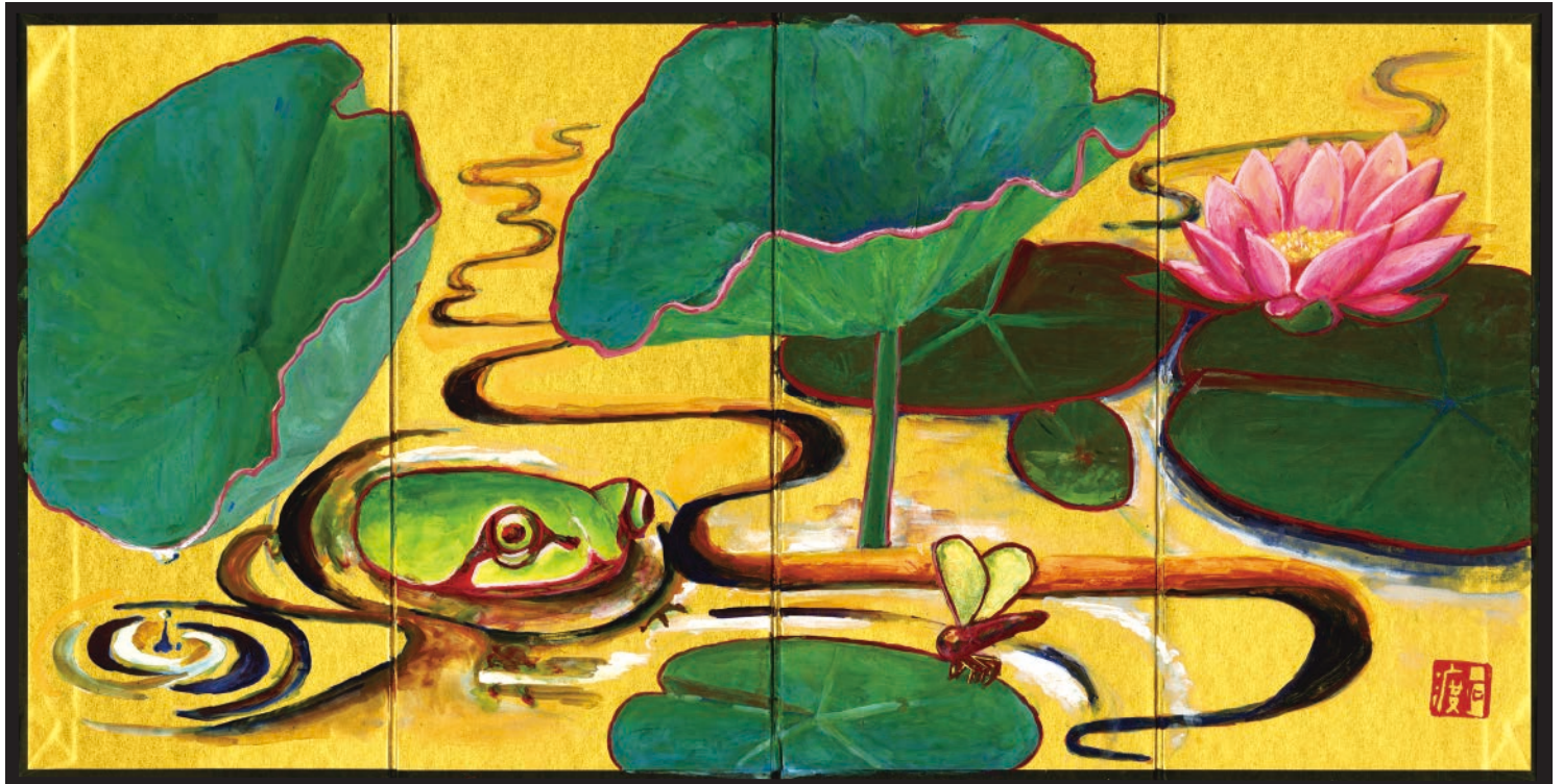
中学校美術作品展 出品予定作品 (中学3年生)

子どもたちが、日ごろ学校で学習した図画工作・美術・書写の意欲あふれる作品を集め、作品展を開催いたします。ご家族そろっておいでくださいますようお願い申し上げます。