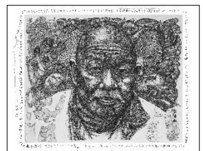
ながさわたかひろ 《KUMAさんに褒められたくて》 2010年 作家蔵

※開催日時や内容等は変更されることがあります。 詳細は8月以降に美術館までお問い合わせ下さい。