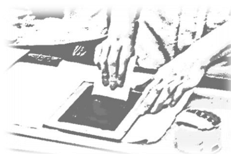
スクリーンプリント