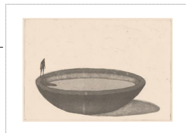
「思い出ボウル」銅版画、1999年

※開催日時や内容等は変更されることがあります。詳細は5月以降に美術館までお問い合わせ下さい。