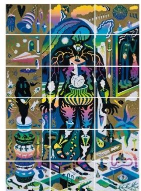
アグン・ブラボウォ《At the Gate of Fate》2018年 リノカット彫り進み技法、作家蔵