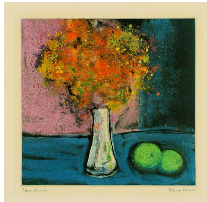
駒井哲郎「花と果実(Fleurs et Fruits)」 1973年 モノタイプ、パステル粉 福原コレクション(世田谷美術館寄託) ©Yoshiko Komai 2010/JAA1000185