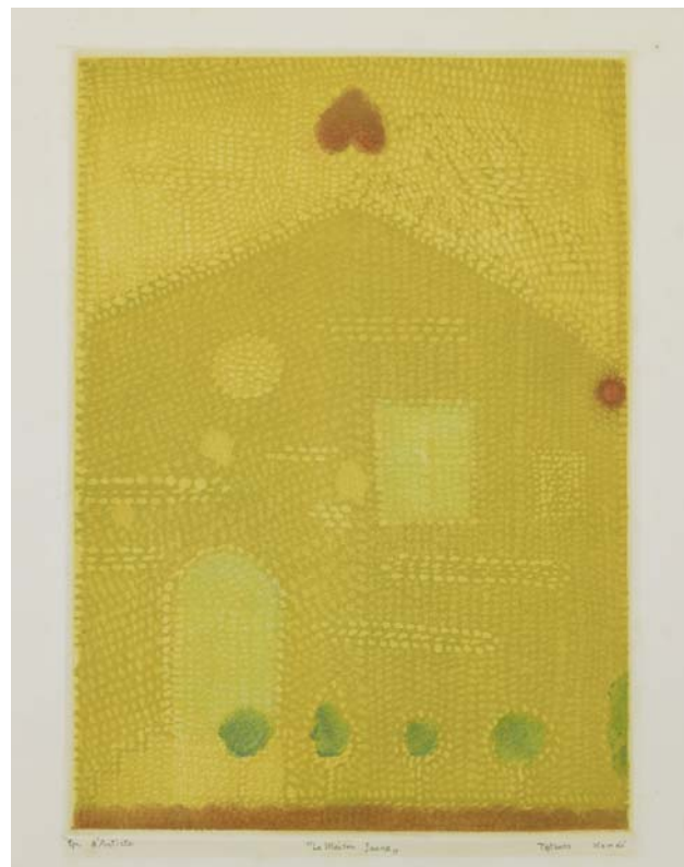
駒井哲郎「La Maison Jaune (黄色い家)」1960年 ディープ・エッチング、アクアチント(1版多色) 福原コレクション(世田谷美術館寄託) ©Yoshiko Komai 2010/JAA1000185