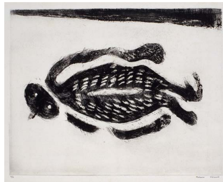
駒井哲郎「鳥の静物(死んだ鳥の静物)」1962年 アクアチント、リフトグラウンド・エッチング、エッチング 福原コレクション(世田谷美術館寄託) ©Yoshiko Komai 2010/JAA1000185