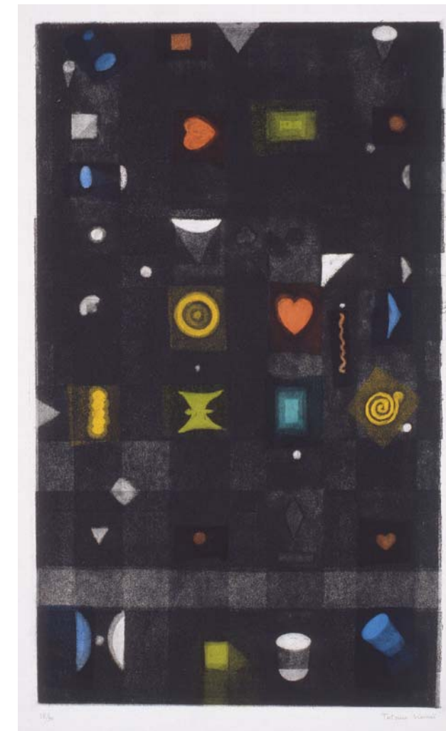
駒井哲郎「時間の玩具」1970年 エッチング(サンドペーパー使用、1版多色) 福原コレクション(世田谷美術館寄託) ©Yoshiko Komai 2010/JAA1000185

***** ◇ 画像ご希望の方は、件名を「駒井哲郎展 画像希望」として、下記アドレスまで希望画 像の番号をお知らせ下さい。