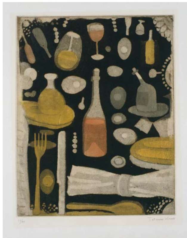
駒井哲郎「食卓I」1959年 アクアチント、エッチング(1版多色) 福原コレクション(世田谷美術館寄託) ©Yoshiko Komai 2010/JAA1000185