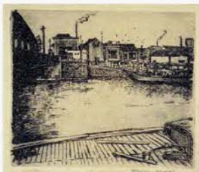
《船着場のある風景》1935年 エッチング