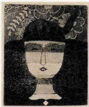
《R夫人像》1970年頃 アクアチントほか