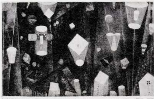
《東の間の幻影》1951年 サンドペーパーによるエッチング