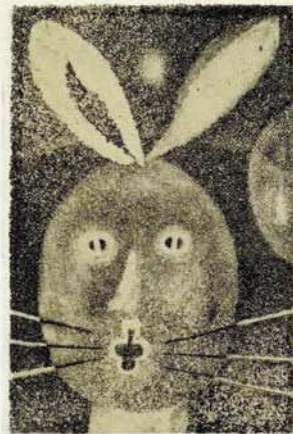
《月の兎》1951年 アクアチントほか