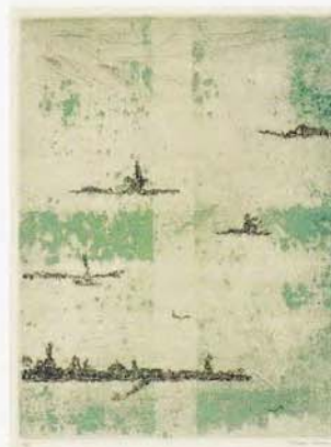
《庭の小さい虫》1961年 エッチングほか