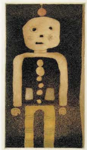
《garçon(少年)》1958年頃 アクアチントほか