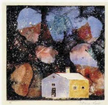
題名不詳 1971年頃 モノタイプ