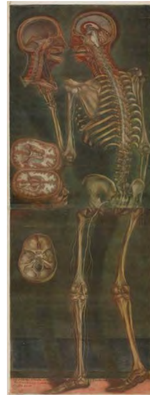
ゴーティエ=ダゴティ (1716-1785) 『人体構造解剖図集』より「骨格 (側面)」 1759 年刊 677×465mm、606×463mm 銅版