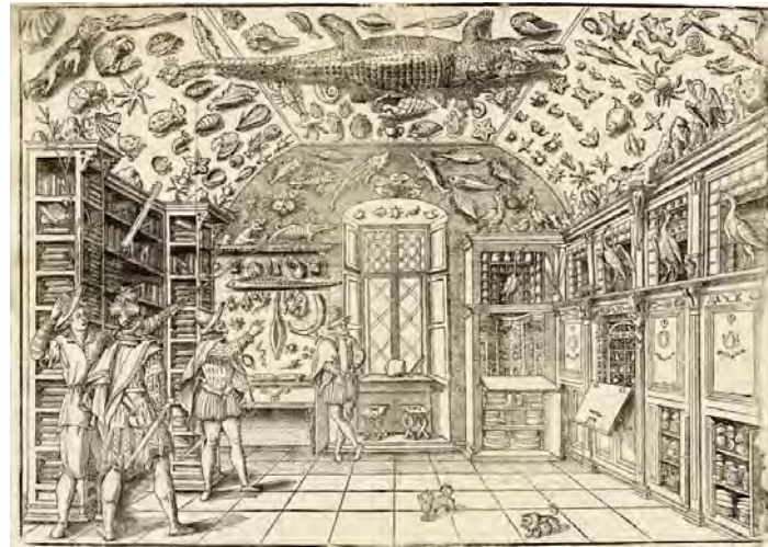
インペラート (1550 頃-1625) 『博物宝典』より「フェッランテ・インペラートの陳列室」 1599 年 277×388mm 木版