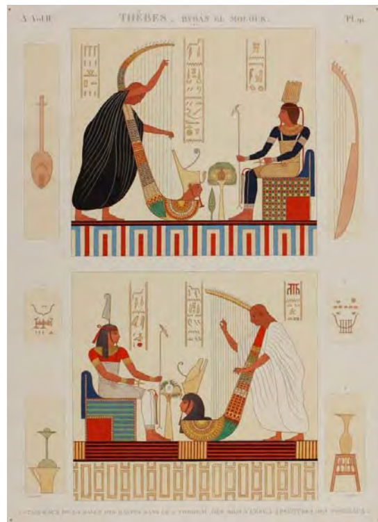
『エジプト誌：考古篇』より「王家の谷の墳墓壁画」 1809-1828 年刊 582×420mm 銅版