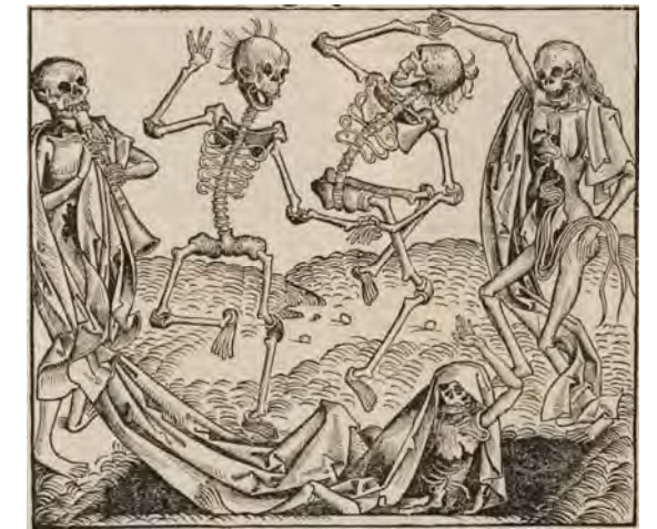
シェーデル (1440 - 1514) 『年代記』より「骸骨の踊り」 ミヒャエル・ヴォールゲムート(1434-1519)画・版刻 ヴィルヘルム・プライデンヴルフ(? - 1494) 画・版刻 1493 年刊 194×224mm 木版