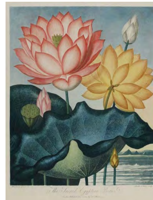
ソーントン編 『フローラの神殿』より「エジプトハス」 1804 年 458×377mm 銅版