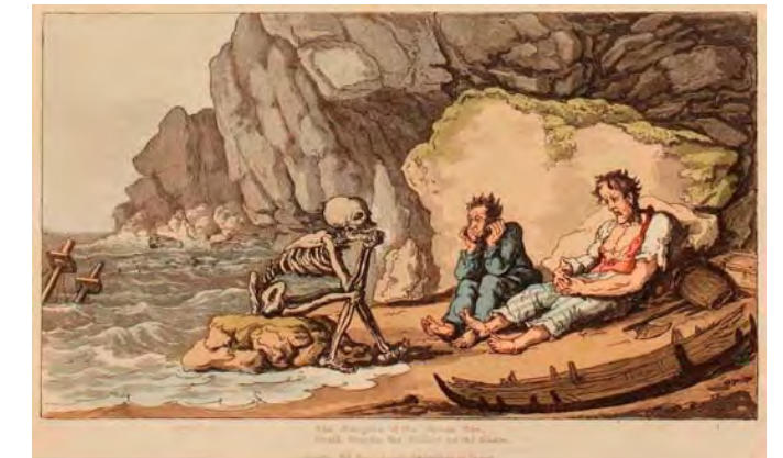
ローランドソン (1756 - 1827) 『英国の死の舞踏』より「難破」 1816 年刊 144×224 mm 銅版 ***** ◇画像ご希望の方は、件名を「驚異の部屋へようこそ！展 画像希望」として、下記アドレスまで希望画像の番号をお知らせ下さい。[町田市立国際版画美術館] bunspo040@city.machida.tokyo.jp ◇キャプションの太字の箇所は、特に必要な情報です。その他は適宜ご掲載ください。 *****