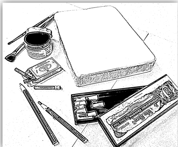
石版石と描画材(イメージ)

トップページのメニューボタン「版画工房・実技講座」から「実技講座」 ⇒「講座内容/申込メールフォーム」とお進みください。「ピックアップ技法講座」の 詳細欄からメールフォームをお開きいただけます。(募集期間内のみ入力可能) 町田市のイベント申込システム「イベシス」からもお申し込み頂けます。