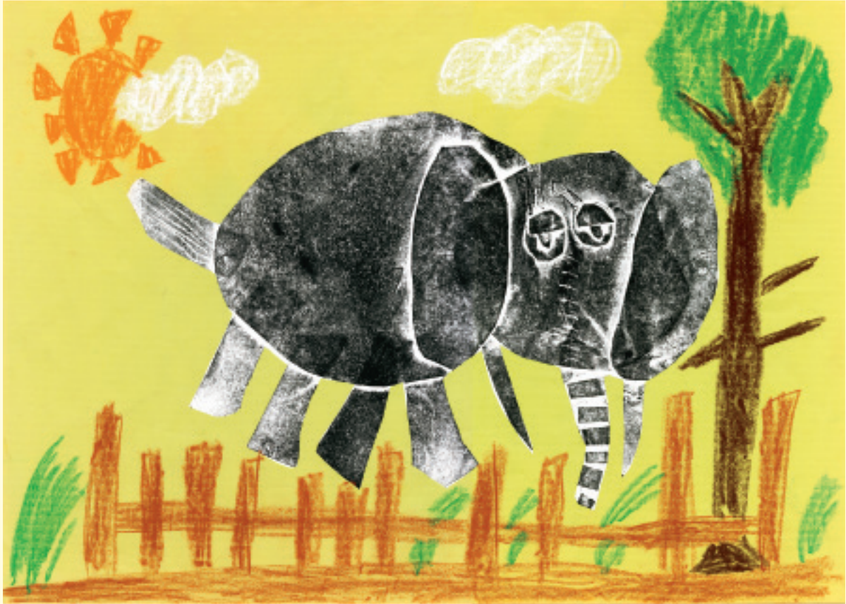
小学校図画工作展出品予定作品（小学2年生）

子どもたちが、日ごろ学校で学習した美術・図画工作・書写の意欲あふれる作品を集め、作品展を開催いたします。ご家族そろっておいでくださいますようご案内申し上げます。