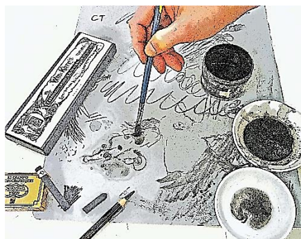
リトグラフの版に描いている様子

開催日時：9/13、20、27、10/4、11、18、25、11/1、8、15、 (水曜日・全10回) 午後1時30分～4時30分