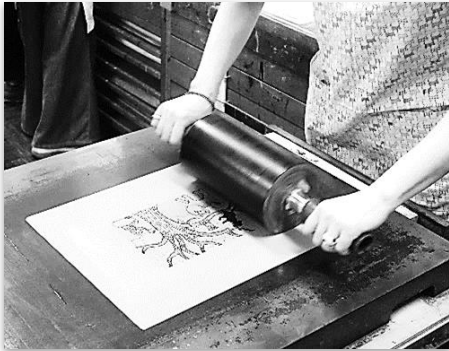
リトグラフの印刷風景 (版にローラーでインクをのせているところ)

版画でありながら、まるで水彩画やペン画やパステル画のような作品・・・それがリトグラフの特徴です。