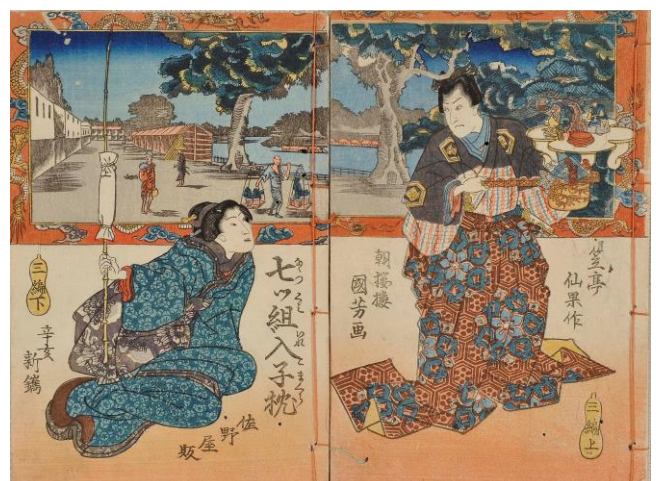
30 『七組入子枕』 三編上・下