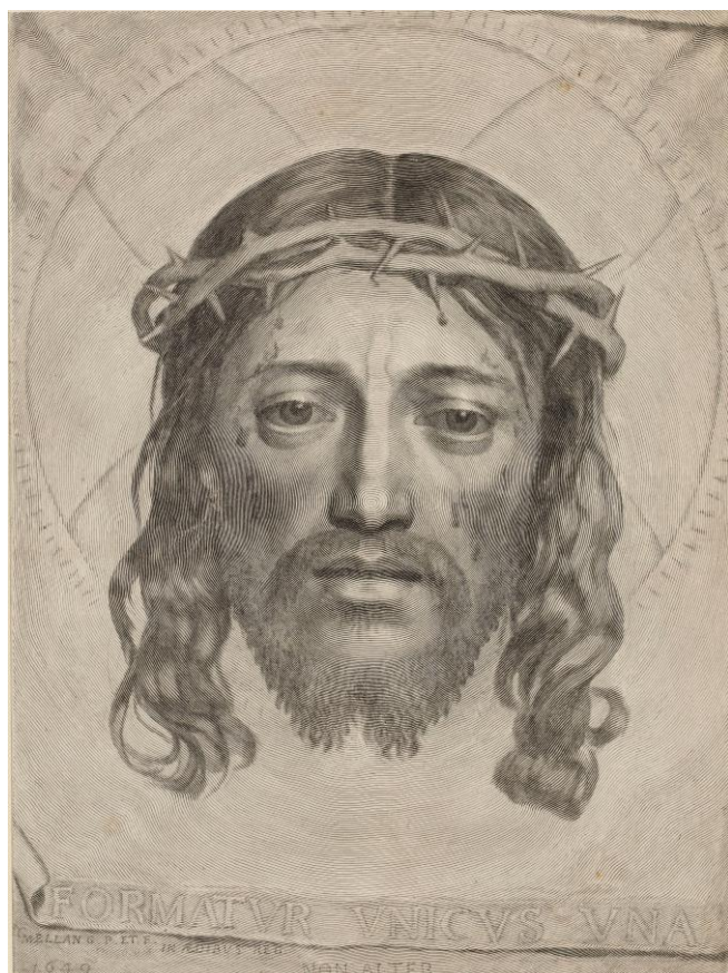
3 クロード・メラン「聖顔」 1649 年 エングレーヴィング

1987 年 4 月の開館以来、当館は版画を中心とするユニークな美術館として、国内外のすぐれた版画作品と資料を収集・保存し、版画をテーマとする展覧会を開催してきました。収蔵品は現在、27,000 点を越えています。「版画」という明確なテーマに基づいたコレクションは、他に類を見ない独自で貴重なものとなっていると自負しています。近年はその活動実績を評価していただき、寄贈作品の数も増加しています。