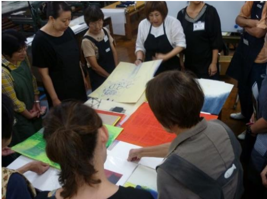
①講座の初日に講師の作品を間近で鑑賞しました。色鮮やかな銅版画の作品に驚きの声があがりました。