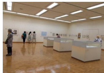
昨年度受講生展の様子

この展示では、美術館で作品を制作し、額装し、展示するまで体験することで作品を他人に観てもらい喜びを感じてもらう事を目的としています。また、展示に向けて、新たな作品を制作する活力になればと思いい例年開催しています。