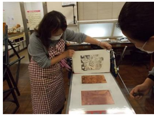
④受講生全員が最後まで作品を仕上げることができました。