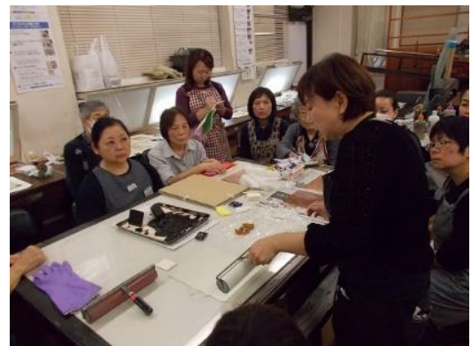
⑤最終日には、講師によるカラー多色刷りの制作を実演をしてもらいました。基礎を学んだからこそ解る講師の技術の高さ、そして銅版画の奥深さに触れました。