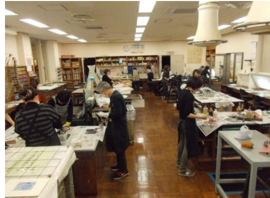
②工房の様子。銅版画は作業工程が多いため、回を重ねるごとに受講生の作業がそれぞれ異なってきます。講師、スタッフと打合せをしながら指導にあたりました。