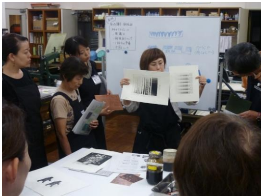
③基礎的な技法(エッチング、アクアチント)に加え、応用技法(スピードバイト、リフトグラウンド、ソフトグラウンド等)も紹介しました。